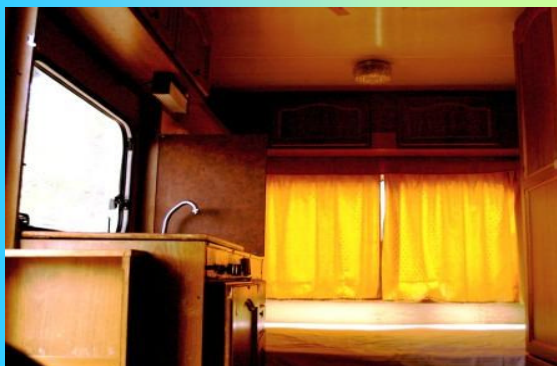
Lato sinistro entrata: letto matrimoniale

LA ROULOTTE E COSI' COMPOSTA: posti letto n. 4, (n. 2 letti matrimoniali disposti: della porta di entrata: n.1 sulla destra n.1 sul lato sinistro della , il bagno e dotato di doccia acqua calda, wc e un piccolo lavabo, nella veranda sono disposti n. 1 tavolo con n. 4 sedie e il frigorifero; le dotazioni per cucinare sono: le stoviglie: forchette, cucchiari, coltelli e cucchiaini, pentole tegami, tagliere, apri scatola ecc. ( l'elenco delle attrezzature è affissa all'interno della roulotte); attrezzatura per la pulizia: paletta per la raccolta rifiuti, scopa, secchio con moccio; nel prezzo sono inclusi il costo delle persone, lenzuola e federe con cambio settimanale, il posteggio macchina, consumo acqua, gas, energia elettrica e le pulizia finale.